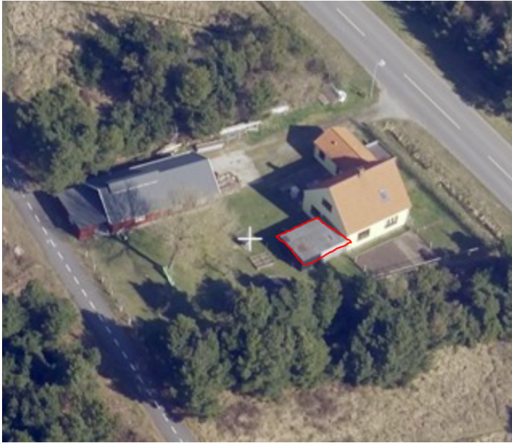
Illustration 1. Den ansøgte placering af drivhuset er markeret med rødt.